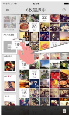
【写真をアルバムに追加】

一覧画面から、右スワイプで アルバムモードに切り替え。 まとめた写真を長押しし て、アルバムにドラッグし、 写真を追加