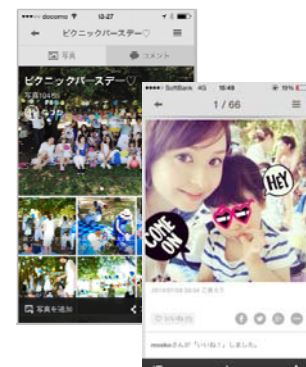
フォトブログが完成！

フォトブログの作り方はこちらでも紹介しています： http://gallery.scn.jp/ja/photo_blog.html